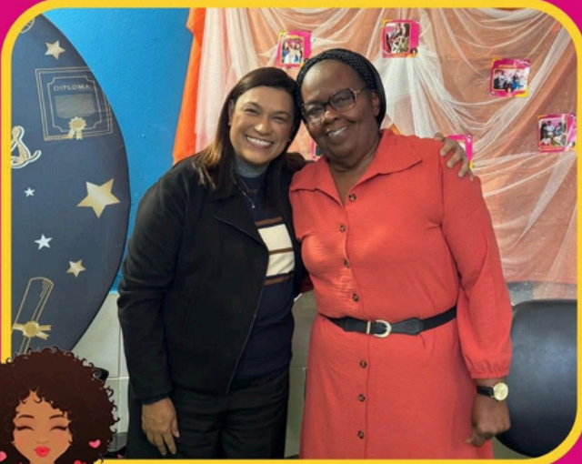
DONA DE MIM